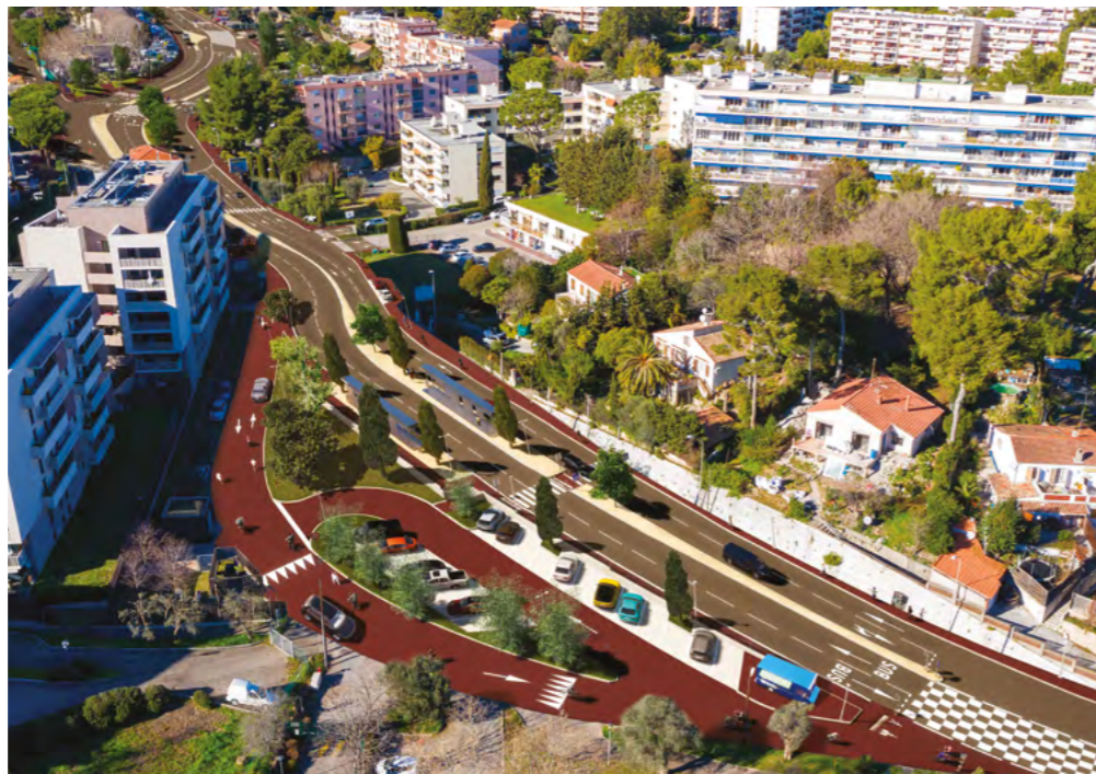
LE NOUVEAU SQUARE CERUTTI