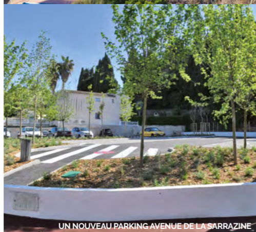
UN NOUVEAU PARKING AVENUE DE LA SARRAZINE