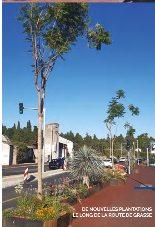
DE NOUVELLES PLANTATIONS LE LONG DE LA ROUTE DE GRASSE