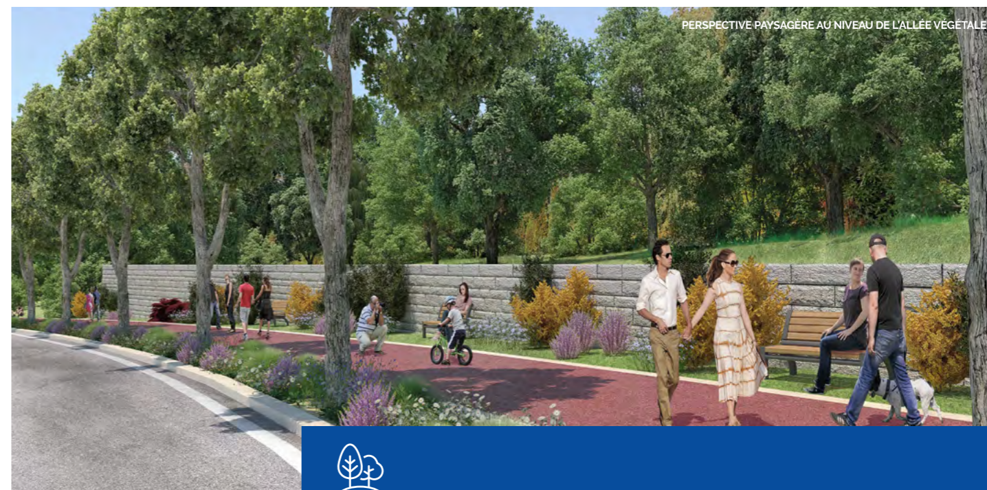
PERSPECTIVE PAYSAGÈRE AU NIVEAU DE L'ALLÉE VÉGÉTALE